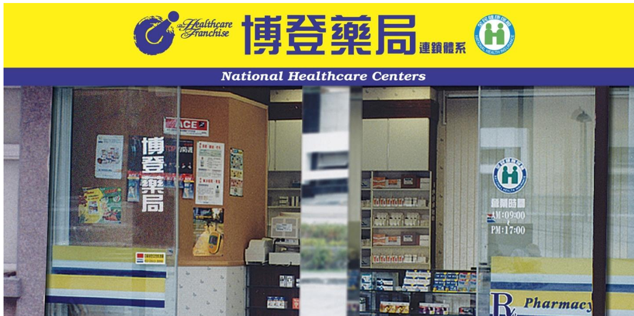
全國最大最專業 調劑藥局連鎖體系